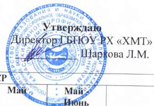
ГРАФИК Подготовки и выполнения ВКР Студентами очного отделения группы 4ПК 2023 – 2024 уч.год